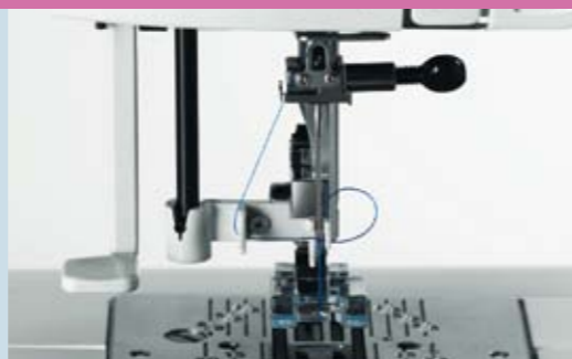
L'enfile-aiguille: parce que les fashionistas aiment aussi la technologie.