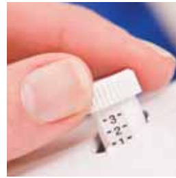
Contrôle de la pression du pied presseur