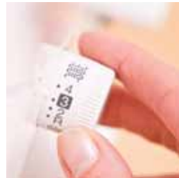
Réglage de la largeur de point