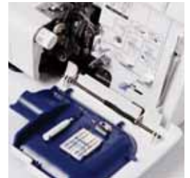
Rangement astucieux des accessoires