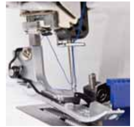
Système d'enfilage automatique du fil