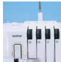
Semplice sistema di infilatura a 4 fili

**F.A.S.T (Fast Simple Threading) : enfilage rapide et simple