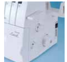
Facile accesso ai tasti di controllo