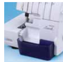
Contentitore porta ritagli