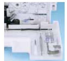
Vano accessori incorporato