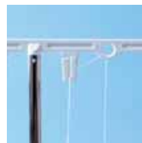
Protezione della tensione del filo