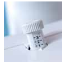
Controllo della pressione