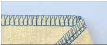
Surjet 4 fils

Gagnez du temps : coupez, assemblez et surjetez les tissus en une seule et même opération !