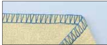
Surjet 3 fils