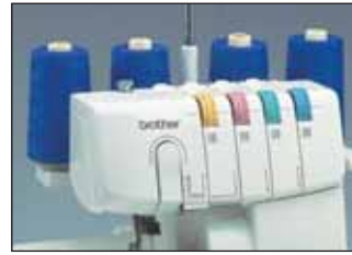
Système d'enfilage simplifié