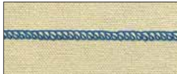
Surjet à plat (Avec pied en option)