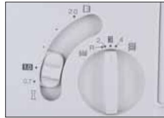
Largeur de point réglable