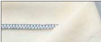
Ourlet invisible (Avec pied en option)