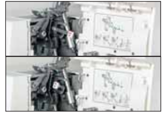
Enfilage rapide du boucleur inférieur